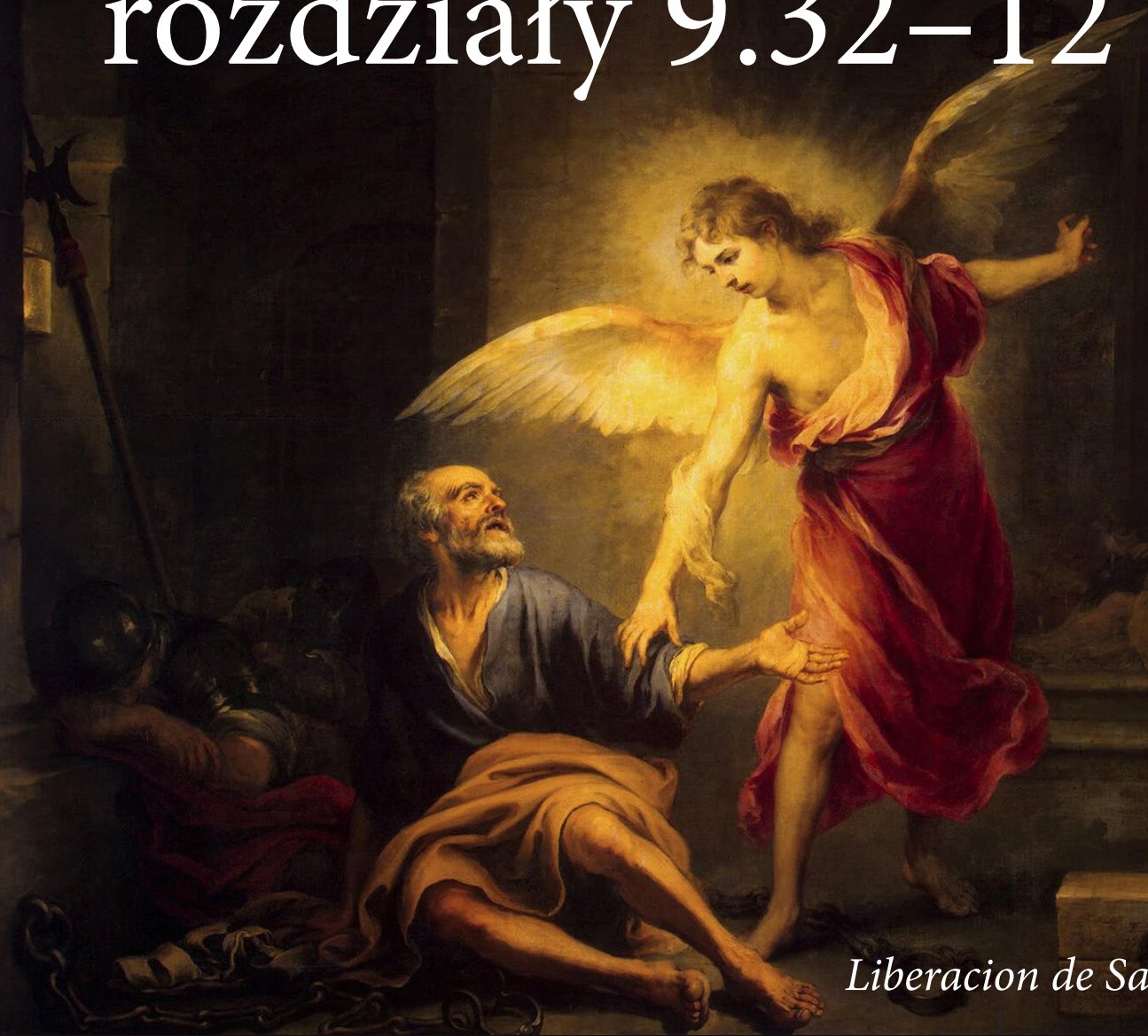
Liberacion de San Pedro Murillo 1667